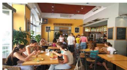
Café de l'école