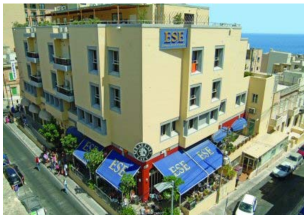
L'école ESE où se dérouleront les cours

Chaque matin, conformément au programme « Junior Club », les jeunes suivront un programme de deux cours d'anglais général et ce, durant la semaine. Les cours sont conçus pour permettre aux jeunes de réviser et d'approfondir leurs connaissances en abordant l'ensemble des aspects de la langue anglaise.