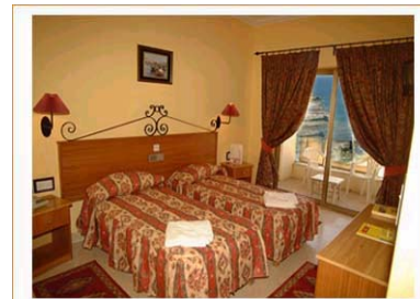
Chambre à 2 lits séparés