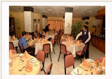
Restaurant de l'hôtel de séjour