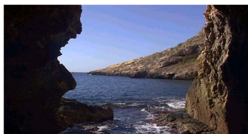
Ile de Gozo