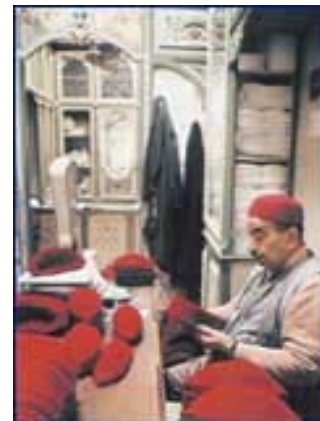
Travail de la chéchia : Artisan au travail

Dîner et nuit à l'hôtel Phébus 4* à Gammarth ou un hôtel similaire à Hammamet.