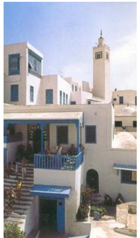
Sidi Bou Said : Café des nattes

Dîner et nuit à l'hôtel Phébus 4* à Gammarth ou un hôtel similaire à Hammamet.