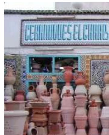
Magasin de poterie à Nabeul

Dîner et nuit à l'hôtel Phébus 4* à Gammarth ou un hôtel similaire à Hammamet.