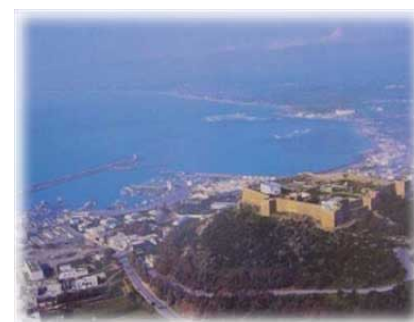
Kélibia La Blanche : vue aérienne

Dîner et nuit à l'hôtel Phébus 4* à Gammarth ou un hôtel similaire à Hammamet.